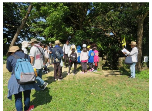
浦添グスクの頂にある「ディーンガマ」。鍾乳洞が陥没してできた窪地で、戦後、市内一円で収集された遺骨はここに集められた。