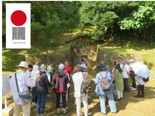
玉城朝薫の墓からスタートです。所在地はモノレール経塚駅から北へ徒歩5分です。

（本市経塚の朝薫が眠る墓（邊土名家の墓）から、那覇市末吉公園にある組踊生誕三〇〇年記念碑、首里城、「国立劇場おきなわ」などを訪ねました。組踊上演の舞台となった首里城御庭では、琉球芸能研究家の大城學先生より、王国時代の様子を解説いただきました）