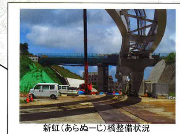
新虹(あらぬーじ)橋整備状況