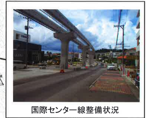
国際センター線整備状況