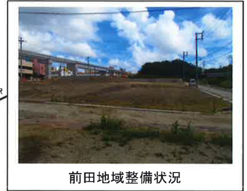
前田地域整備状況