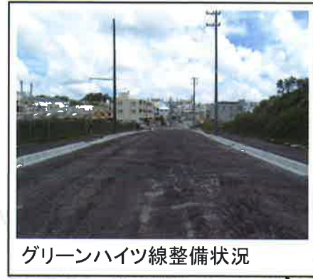
グリーンハイツ線整備状況