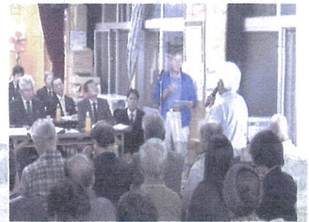
(フロアからの質問)

次に、大平自治会からの下記要望・提言等について行政からの説明・回答を受け質疑応答の形で進めていきました。