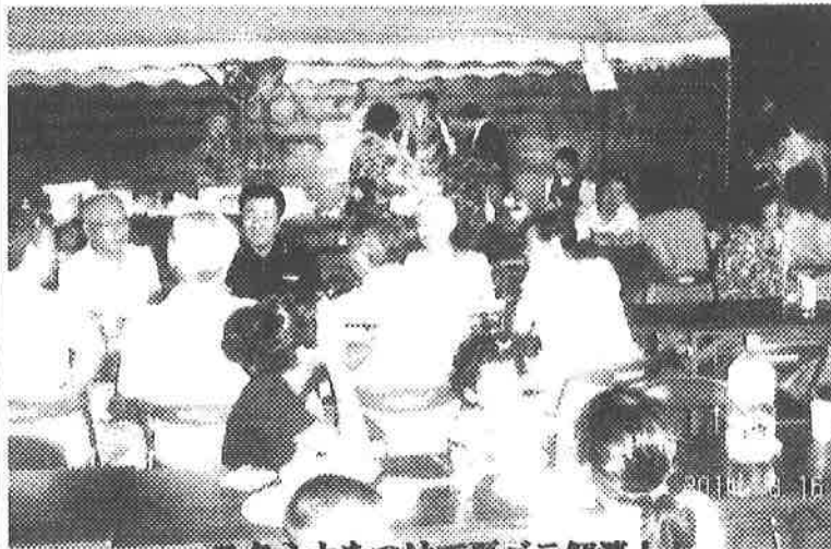
スタミナをつけて夏バテ解消！！

8月16日、夕刻、大平公民館で納涼会が開催されました。夕涼みをしながら、会員相互の親睦と連帯協力体制を図る事を目的にした催しです。午前中の雨も上がり、100余名の参加者で大いに賑わいました。