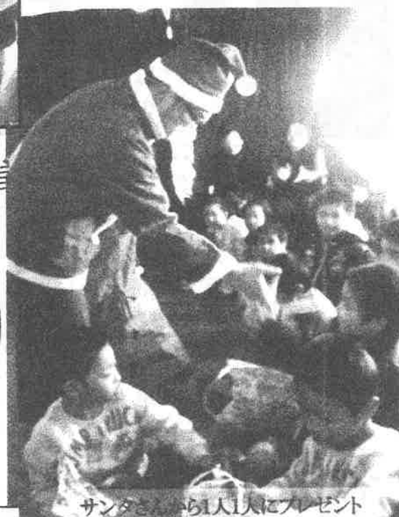
サンタさんから1人1人にプレゼント