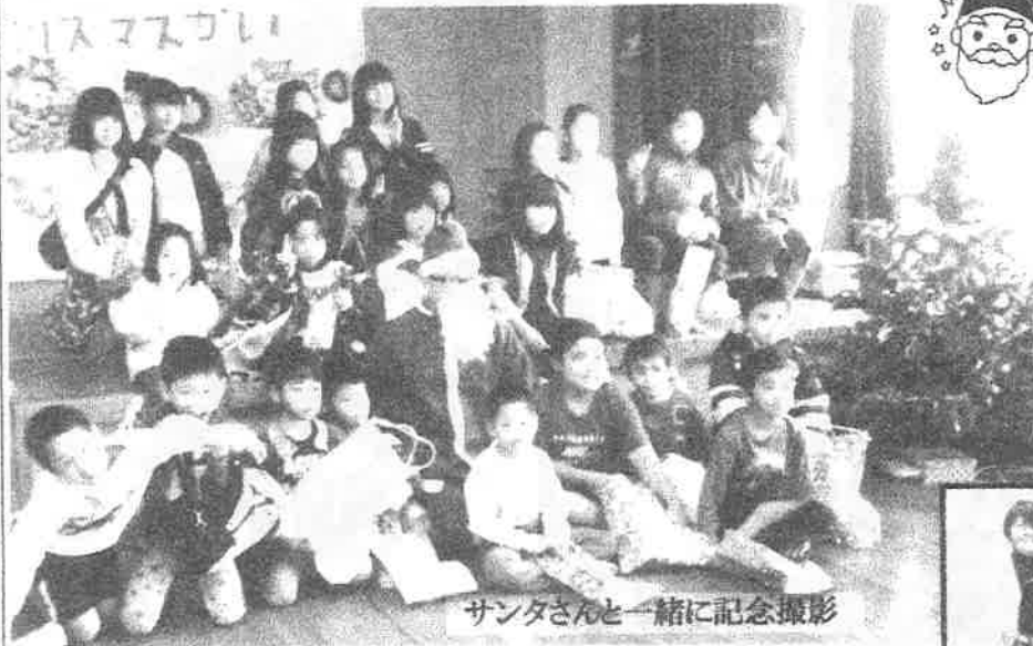
サンタさんと一緒に記念撮影