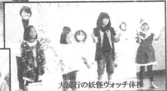
大流行の妖怪ウォッチ体操