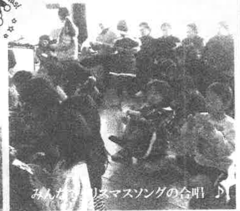
みんながクリスマスソングの合唱