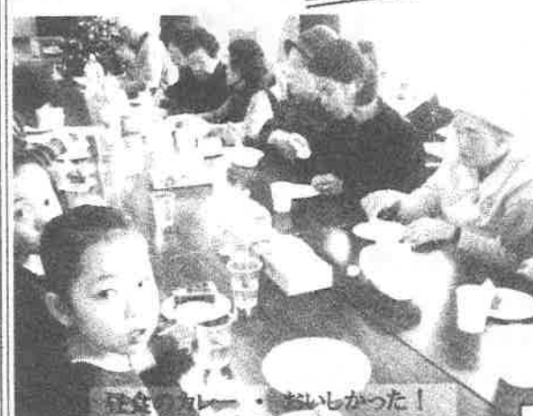
昼食のカレー・おいしかった!