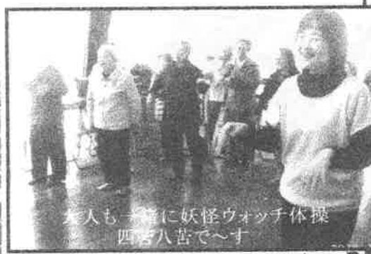
大人も一緒に妖怪ウォッチ体操 四苦八苦で〜す