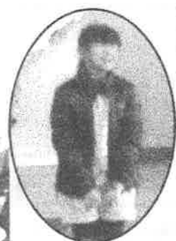
名司会進行でした