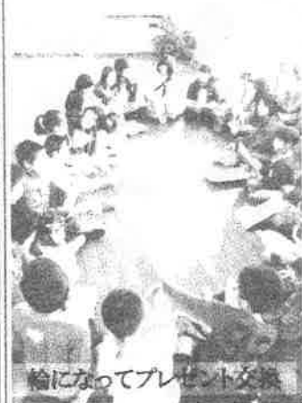
輪になってプレゼント交換