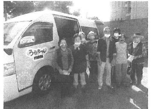
(うらちゃん社内見学)