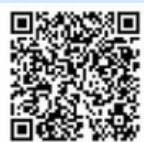
浦添市LINE公式アカウント