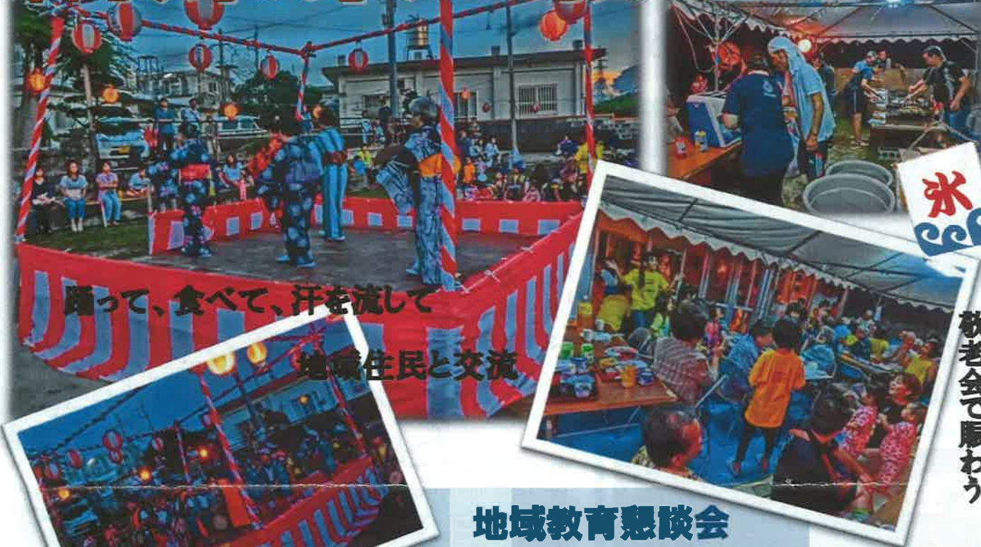
踊って、食べて、汗を流して 地域住民と交流