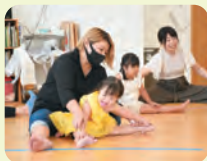
あいかな認定こども園 親子ダンス