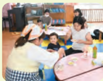
あおいこども園 給食体験