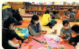
牧港こども園 子育てひろば 「さんさん」