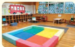
当山こども園 子育てひろば 「にこにこ」