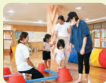
港川こども園 巧技台で遊ぼう！