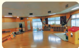
浦添こども園 子育てひろば 「あいあい」