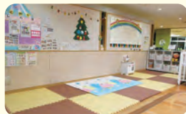
内間こども園 子育てひろば 「わくわく」