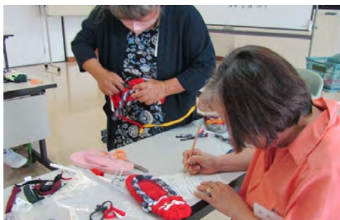
リサイクル関連講座