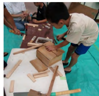
リサイクルまつり