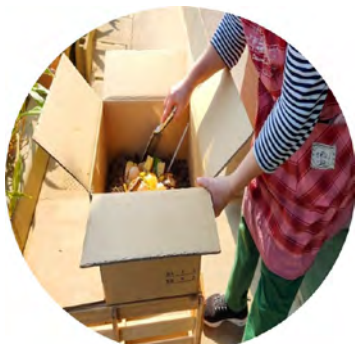
リサイクル関連講座