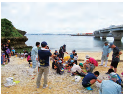
カーミーギー漂着ごみ調査