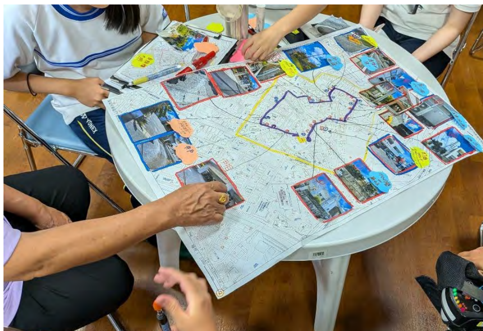
(資料) 防災危機管理課