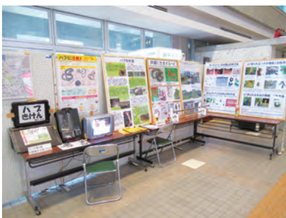
環境月間パネル展