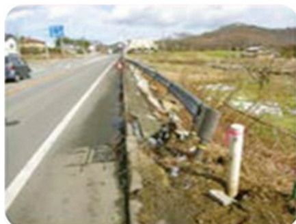
ガードレール・ 標識等の損傷