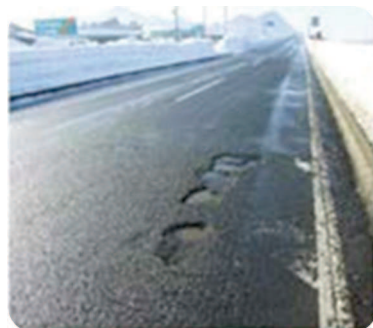
路面の穴ぼこ・ 段差