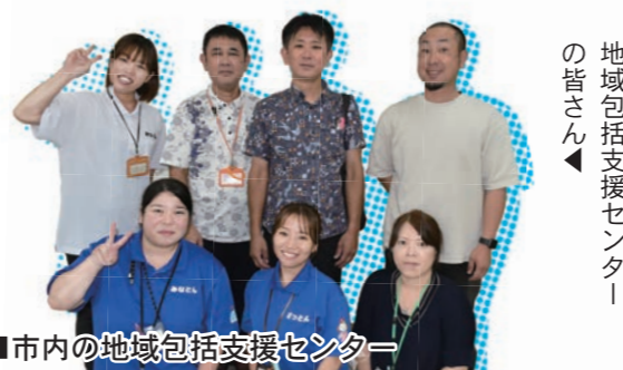
地域包括支援センターの皆さん▲