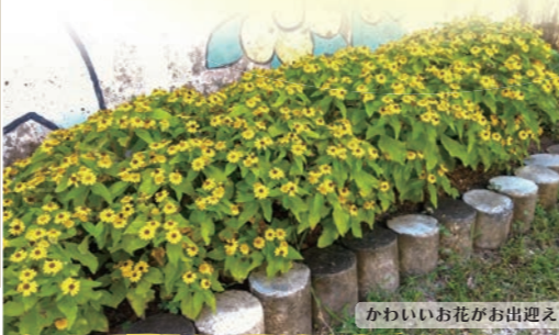
かわいいお花がお出迎え